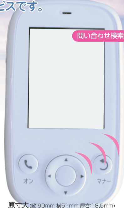
原寸大(縦:90mm 横51mm 厚さ:18.5mm)