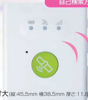
原寸大(縦:45.5mm 横38.5mm 厚さ:11.85mm)